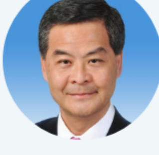
梁振英 Leung Chun-ying

开场致辞：粤港合作 Opening Remarks: Guangdong & Hong Kong Collaboration